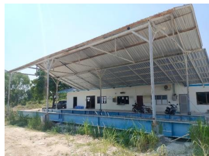
อาคารสำนักงาน