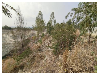
แนวเวนพื้นที่ทำเหมือง