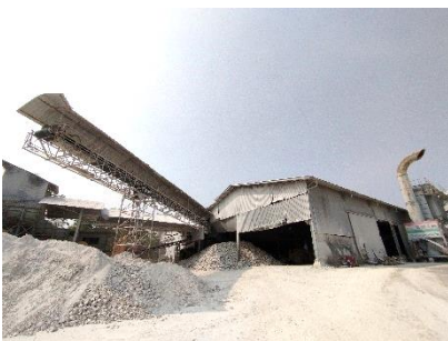
พื้นที่โรงแต่งแร่ของโครงการ